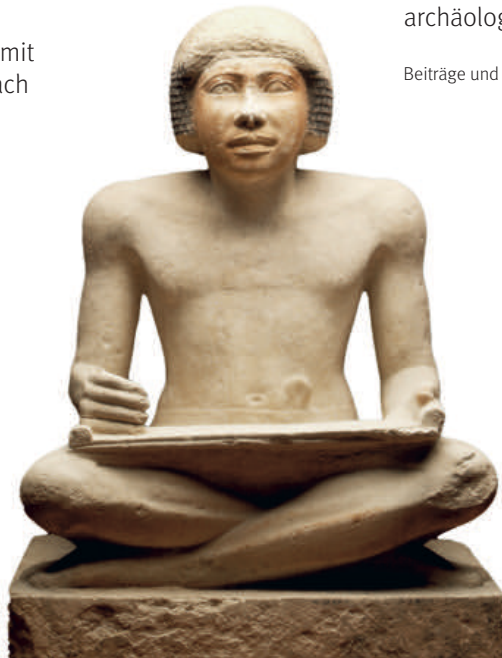
Schreiberfigur des Heti Altes Reich, 5. Dynastie, um 2380 v. Chr.