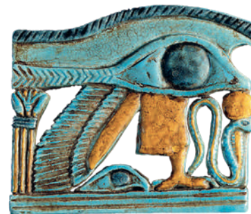
Großes Amulett in Form eines Udjat-Auges Spätzeit, 25. Dynastie, 720-664 v. Chr.

Beiträge und Spenden sind selbstverständlich steuerlich abzugsfähig.